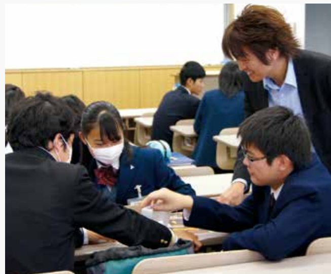
※STEMとは…Science, Technology, Engineering, Mathematicsのこと あいちSTEM能力育成事業「知の探究講座」

教育福祉学部と情報科学部が年度ごとに担当し、高校生の幅広い学びの機会の提供に努めています。