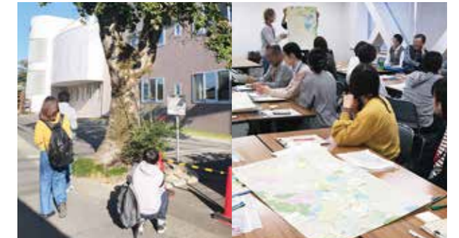
長久手市4大学合同ワーキング

また、令和元年6月に「名古屋市志段味古墳群歴史の里」の指定管理者であるしだみの里守グループと本学は、地域社会の発展と人材育成等に寄与することを目的として、連携協定を締結しました。本協定に基づき、相互が保有する情報、資源、研究成果等の交流を深めることで両者の活動を活性化させ、広く地域社会に貢献することを目指します。