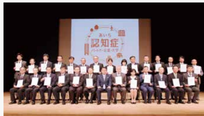
あいち認知症パートナー大学 登録証授与式

また、長久手市の認知症カフェ「喫茶オレンジ」運営に学生や教職員が協力し、認知症介護の経験者、社会福祉協議会等の支援者との情報共有に努め、地域の有機的な連携体制の一翼を担っています。