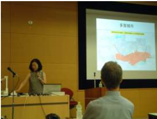
【上山氏講演の様子】