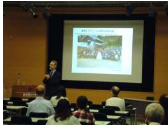
【モリス氏講演の様子】