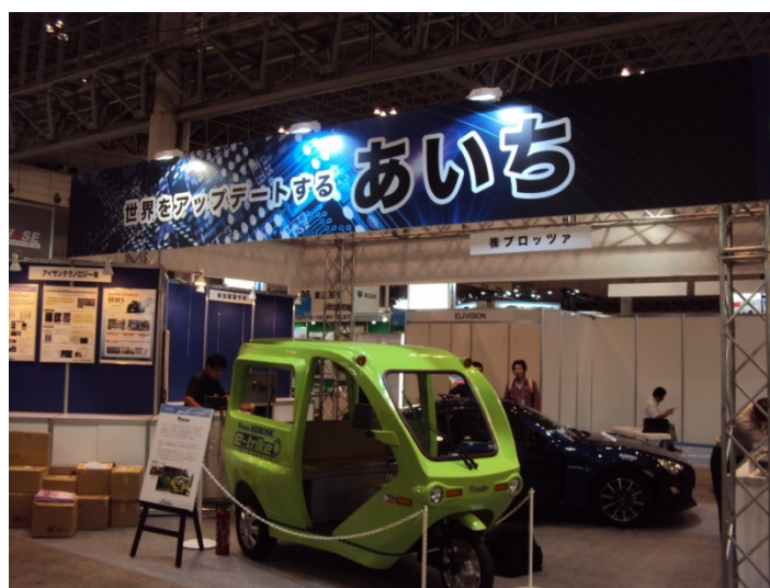
愛知県ブースの全景（正面から右側）