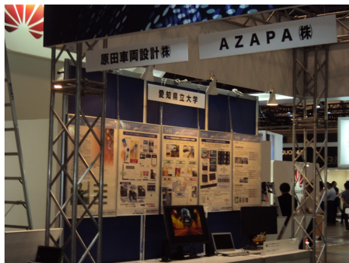
愛知県立大学の展示状況