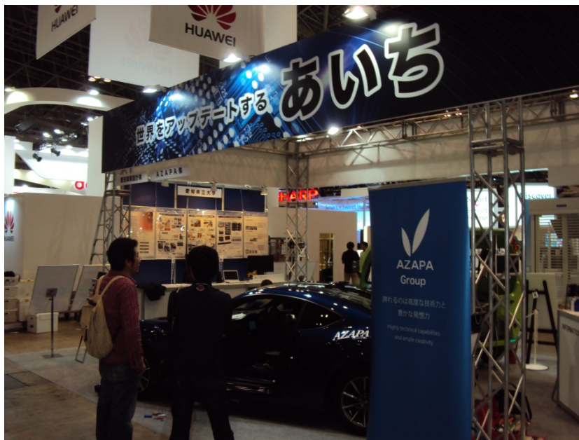
愛知県ブースの全景 (正面から左側)